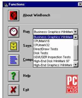
Arbeitsoberfläche von WinBench99 / WinStone99